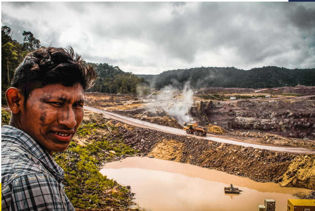
Líder del pueblo Kayabi observando el inicio de la construcción de la central hidroeléctrica de São Manoel en su territorio.