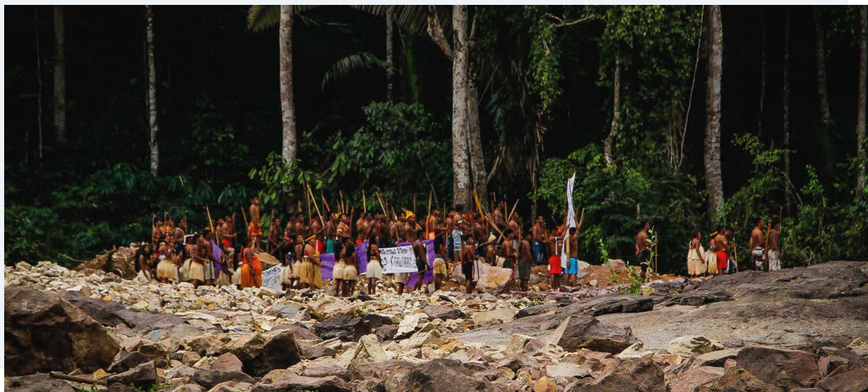
Demostración en la obra de la Unidad Hidroeléctrica de São Manoel.

Diez (10) de los catorce (14) proyectos documentados han generado abusos de los derechos de los pueblos indígenas, incluyendo todos los proyectos hidroeléctricos, de hidrocarburos y de construcción de infraestructura. Estos proyectos se emplazan en territorios de comunidades locales que rechazan este tipo de actividades por sus impactos ambientales y sociales negativos. Así, inversionistas y financistas chinos no cumplen con procesos de debida diligencia, y deciden realizar actividades empresariales en áreas con alto potencial documentado de conflictividad social y riesgos sociales y ambientales.