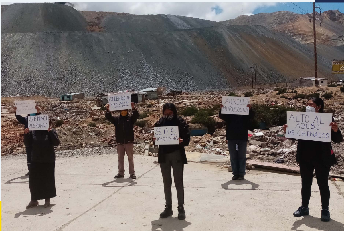
Unidad Minera Toromocho (Perú)