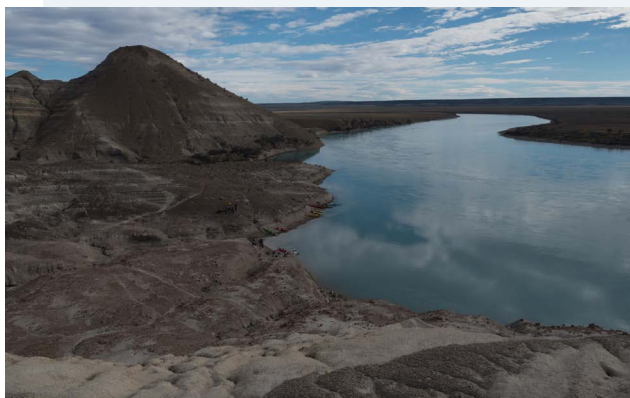
Bahía de los fósiles.

En al menos diez (10) casos, los proyectos carecen de una licencia ambiental adecuada, con base en un Estudio de Impacto Ambiental (EIA) exhaustivo y debidamente socializado con los grupos afectados. En algunos casos, los proyectos se realizan con un EIA antiguo (San Carlos-Panantza), incompleto y que carece de estudios relacionados al impacto socioambiental sobre pueblos indígenas (São Manuel). En otros casos, los proyectos se modificaron y ampliaron mediante un procedimiento denominado “pertinencia”, que se encuentra al margen del Sistema de Evaluación de Impacto Ambiental (Rucalhue, Dumestre) 81 . También se evidencia que los estudios ambientales no están accesibles al público (Ivirizu) o no fueron debidamente socializados con las comunidades afectadas (Buriticá, Tren Maya). En el caso del Tren Maya (México), el EIA no dispone de información suficiente con base en estudios de viabilidad, funcionamiento y rentabilidad del proyecto, mientras los estudios y las autorizaciones fueron otorgados por las mismas instituciones que ahora promueven el proyecto. En el caso de la Planta Dumestre (Chile), las autoridades realizaron una simple Declaración de Impacto Ambiental (DIA), menos rigurosa que un EIA, a pesar de la envergadura del proyecto.