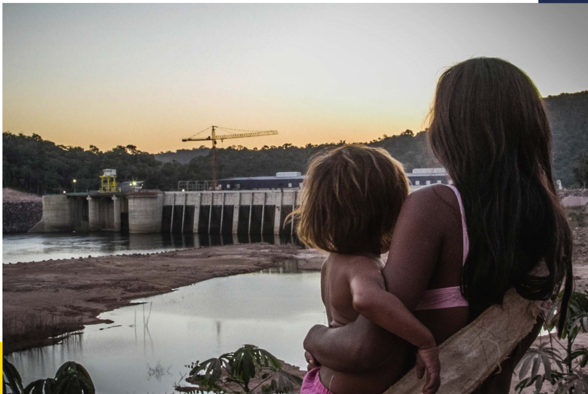
Madre y niño del pueblo Munduruku observando la destrucción causada por la Unidad Hidroeléctrica de São Manoel en su territorio.