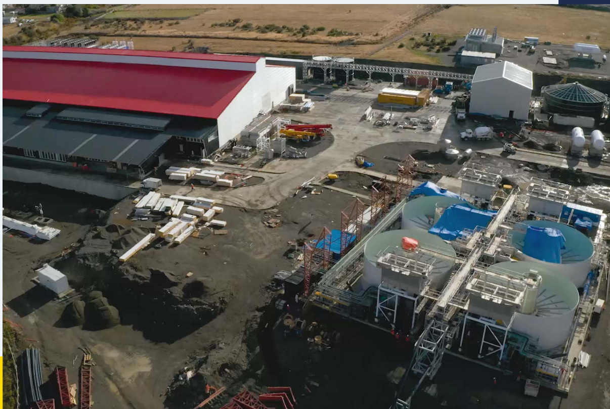
Planta Procesadora de Recursos Hidrobiológicos Dumestre (Chile) - CICDHA © Greenpeace