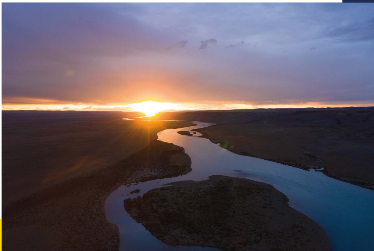
Complejo hidroeléctrico en el río Santa Cruz (Argentina)