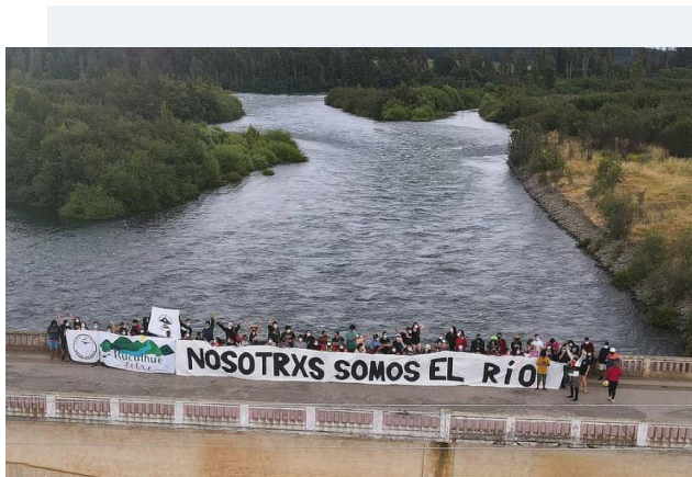
Somos el río

La ausencia de una consulta adecuada que logre el consentimiento previo, libre e informado de las comunidades afectadas caracteriza al menos ocho (8) proyectos (Mirador, San Carlos-Panantza, Río Santa Cruz, São Manuel, Orinoco, Rucalhue, Tren Maya, Planta Dumestre). En el caso del Río Santa Cruz, un juez federal judicial falló en 2021 en favor de las comunidades afectadas por el proyecto, solicitando el cumplimiento por las autoridades argentinas de sus obligaciones y compromisos contraídos, incluyendo un proceso de consulta con dichas comunidades. Del mismo modo, la justicia federal brasileña suspendió el proyecto São Manuel, aunque la decisión fue luego derogada.