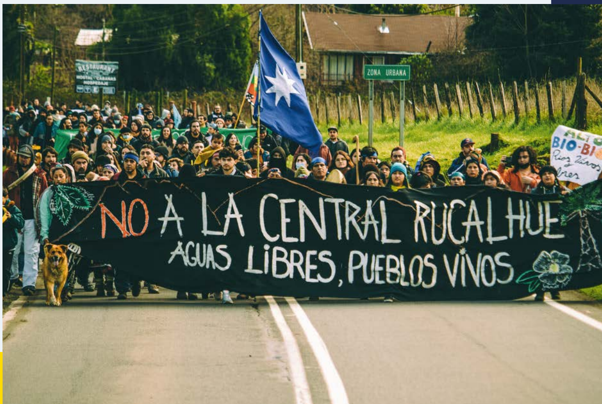
Central Hidroeléctrica Rucalhue (Chile): Marcha Quilaco