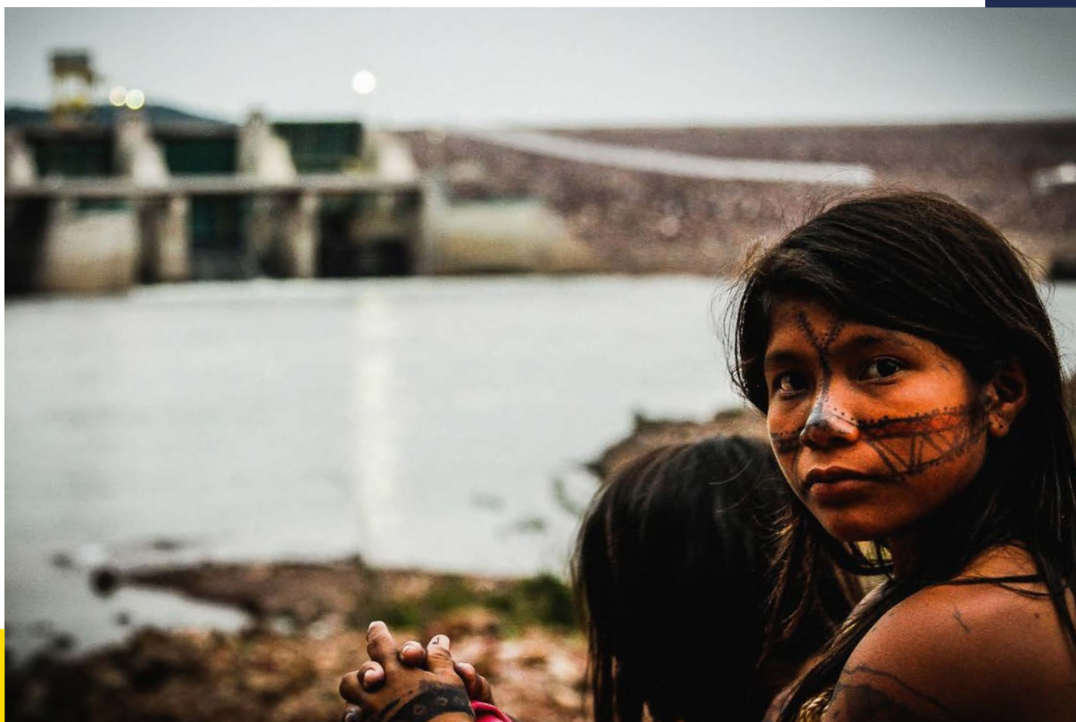
Niño del pueblo Munduruku observando la destrucción causada por la central hidroeléctrica de São Manoel en su territorio.