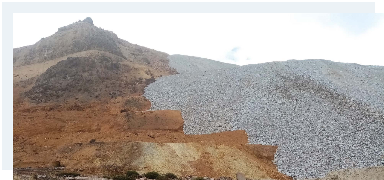
Unidad Minera Toromocho (Perú)

Todos los proyectos documentados en este informe están situados en ecosistemas frágiles y generaron un impacto ambiental significativo. Los tres proyectos situados en Ecuador, dos en el sector minero y uno de explotación de hidrocarburos, se encuentran en la cuenca amazónica ecuatoriana: solo el proyecto minero Mirador impacta al menos 16 ecosistemas diferentes, donde se encuentran 4.000 especies de plantas y hasta 400 especies de algas 71 .